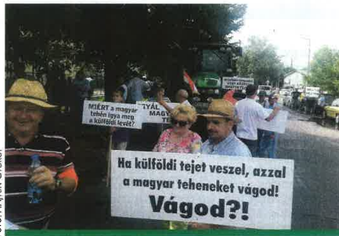
A nagytarcsai tüntetők

áron képes felvenni a magyar tejet, akkor az EU biztosítson exportszubvenciót azokhoz a tejtermékekhez, amelyek az EU-n kívül egyébként keresettek. Ezzel a szubvencióval elkerülhető lenne, hogy dömpingár alakuljon ki a túlkínálat miatt az EU egyes tejpiacain. A magyar kormány megvan a lehetősége, hogy ilyen lépést kezdeményezzen az Európai Unióban.