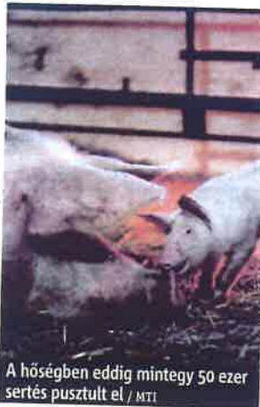
A hőségben eddig mintegy 50 ezer sertés pusztult el