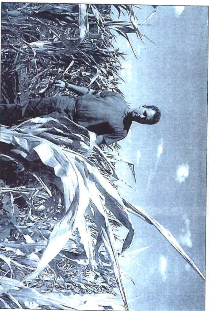
A növénytermesztőket eddig 200 milliárd forintos kár érte az afrikai jellegű száraz időjárás miatt. Csak kukoricából várhatóan negyven százalékkal kevesebbet takaríthatnak be a gazdák ebben az évben