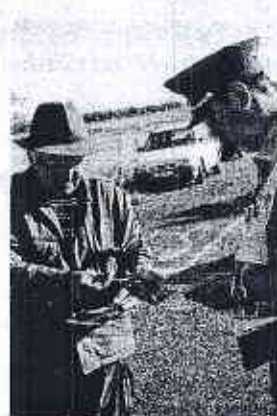
Kérem, igazolja magát!